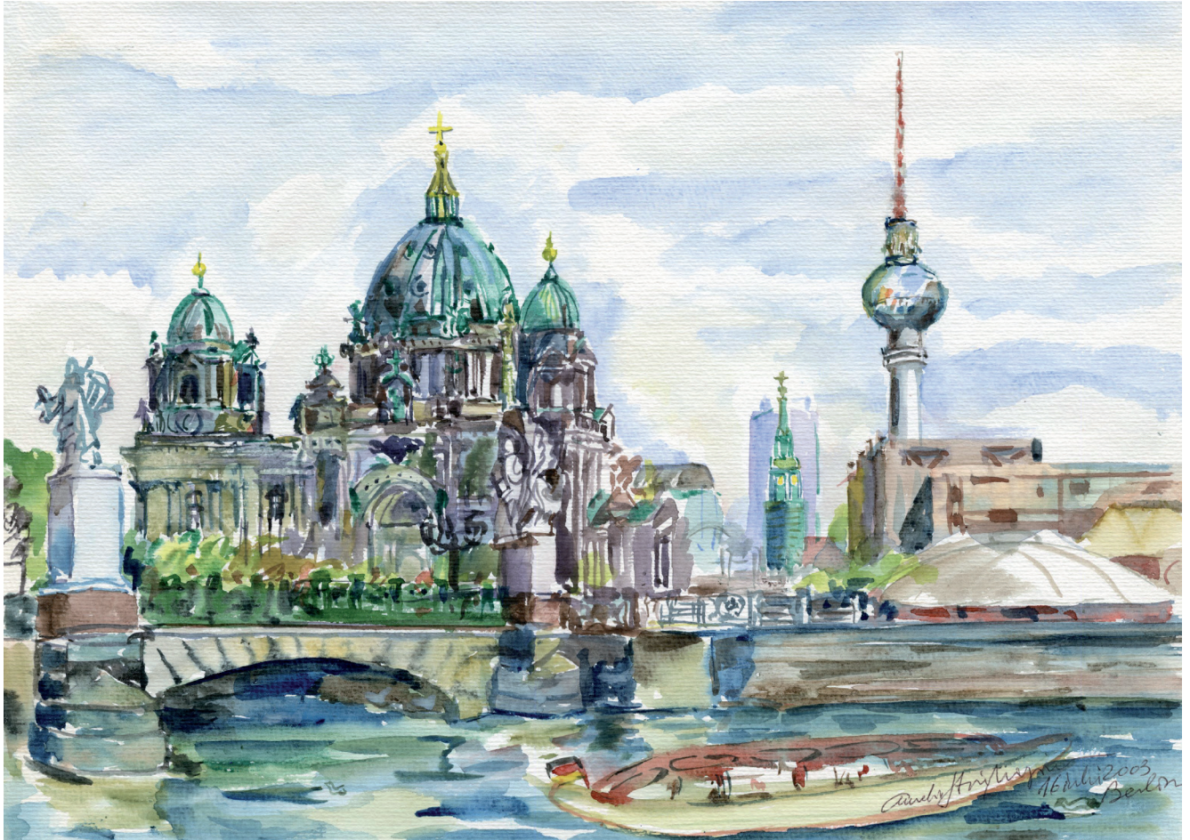
📍 01. Berliner Dom.